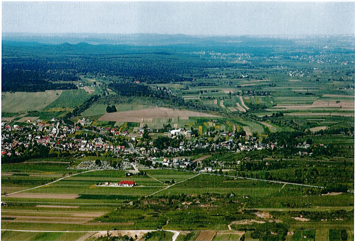
Łągów z lotu ptaka