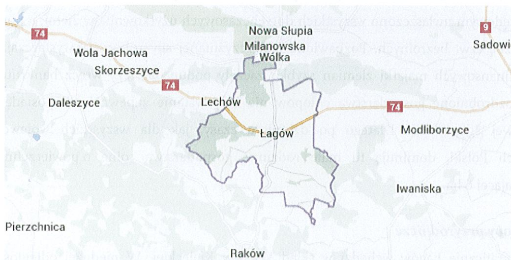
Rysunek 1 Położenie Łagowa

Niniejsze opracowanie zawiera charakterystykę miejscowości, inwentaryzację zasobów służącą ujęciu stanu rzeczywistego, analizę SWOT czyli mocne i słabe strony miejscowości oraz planowane zadania inwestycyjne i przedsięwzięcia.